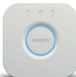
HUE Bridge Version 2