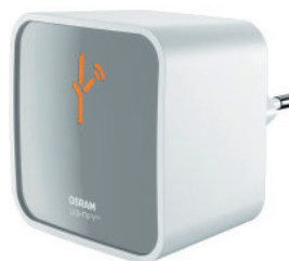
Osram Lightify Bridge