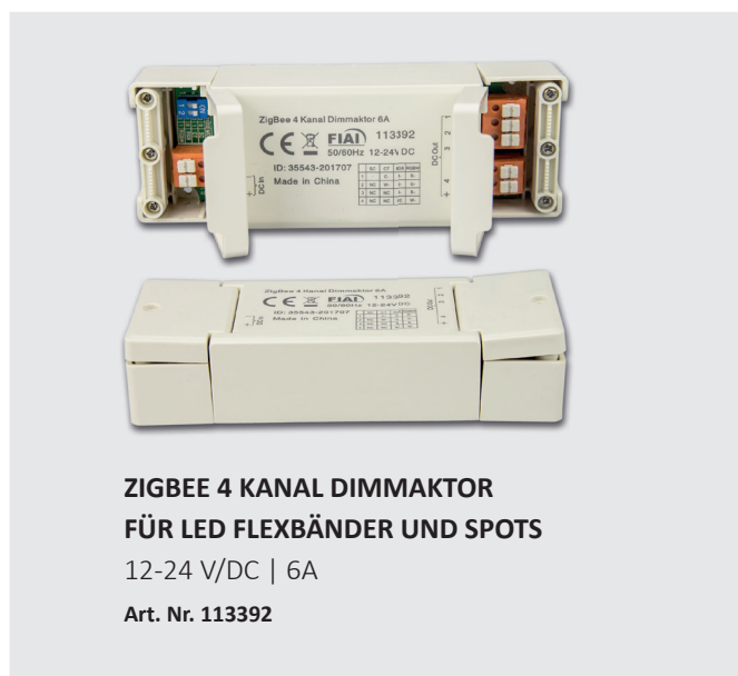
ZIGBEE 4 KANAL DIMMAKTOR FÜR LED FLEXBÄNDER UND SPOTS

Grundsätzlich sollte als Brückengerät auch Osrams' Lightify Bridge funktionieren. Diese besitzt keinen LAN Anschluss sondern wird per WLAN ins Heimnetz eingebunden. Aktuell scheint die Bridge von Osram aber ausschließlich die WLAN Kanäle 1-11 zu unterstützen. Die meisten WLAN Router arbeiten jedoch bereits mit der Kanalbreite 1-13 weshalb sodann häufig keine Kommunikation der Bridge mit dem Router zu Stande kommt.